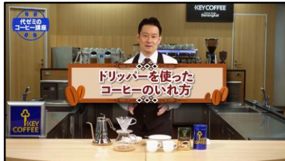
第9話「おいしいコーヒーのいれ方」(キーコーヒー-藤田講師)