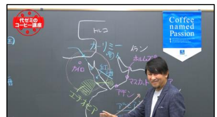
第10話「コーヒーは世界にどう広まった?」(代ゼミ佐藤講師)