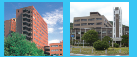
筑波大学 岡山大学