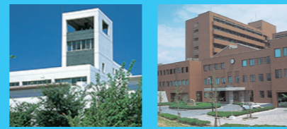
千葉大学 広島大学