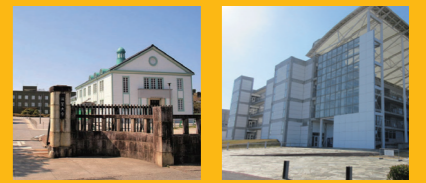
滋賀大学 北九州市立大学