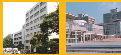
埼玉大学 愛知県立大学