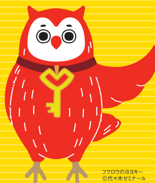
フクロウのヨヨキー